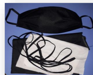
MASCARETES FETES AMB TEIXIT DE PARAIGÜES (PAS A PAS)

Hem apostat per alinear les accions conduents a contribuir a l'emergència sanitària i els seus efectes a altres nivells amb els objectius del propi projecte d'enfortir la sostenibilitat de les persones, les comunitats i l'entorn de manera integrada. L'adaptació de les intervencions previstes en el projecte, el tipus de contacte amb els agents habituals i el format de les accions s'ha encaminat cap al format virtual, en la mesura del possible, per mantenir vincles i espais de sensibilització propis. En el marc de la creació de continguts relacionats amb les necessitats sorgides per l'emergència sanitària i la crisi econòmica conseqüent destaquem el bloc de propostes DIY "Pas a Pas" entorn el consum responsable a través del reaprofitament de recursos, els horts urbans i la neteja natural.